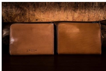
ラウンドファスナー二つ折りウォレット 16,000円（税込）