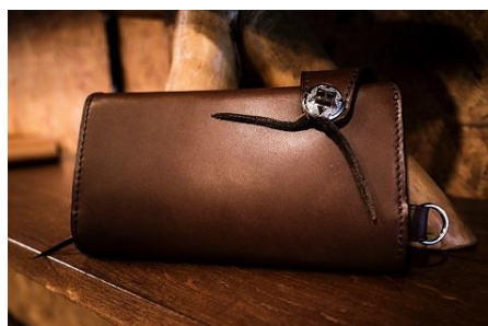
コンチョ付ロングウォレット 38,000円（税込）