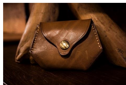
折りたたみ小銭入れ 15,000円（税込）