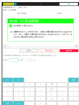
① 単元ごとに問題演習

これまで、トライアルとして一部教室にて試用した結果を踏まえ、株式会社メイツと共に改善を重ねて参りました。