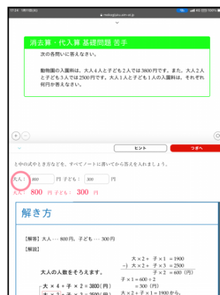
③ 苦手問題の類題を反復演習