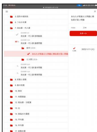
② 正答状況により苦手を特定