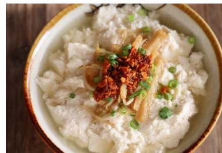
チャーハンやサラダ、豆腐にかけるだけで料理のアクセントに！