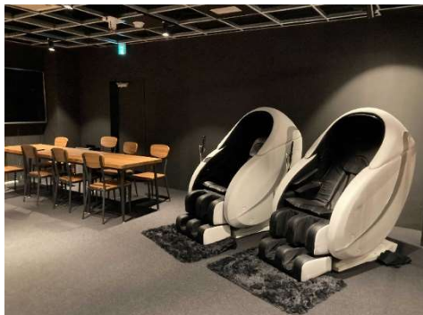
福利厚生のためのオフィスへの導入例

「あんま王」は「待ち時間の有効活用」の他、「施設利用者のリラックス」や「遊休スペースの収益化」などさまざまな目的で導入されています。