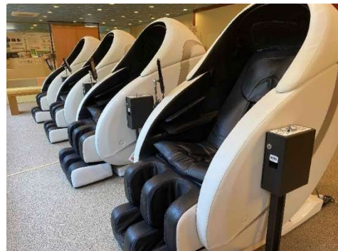
温泉ホテルのロビーでの導入例