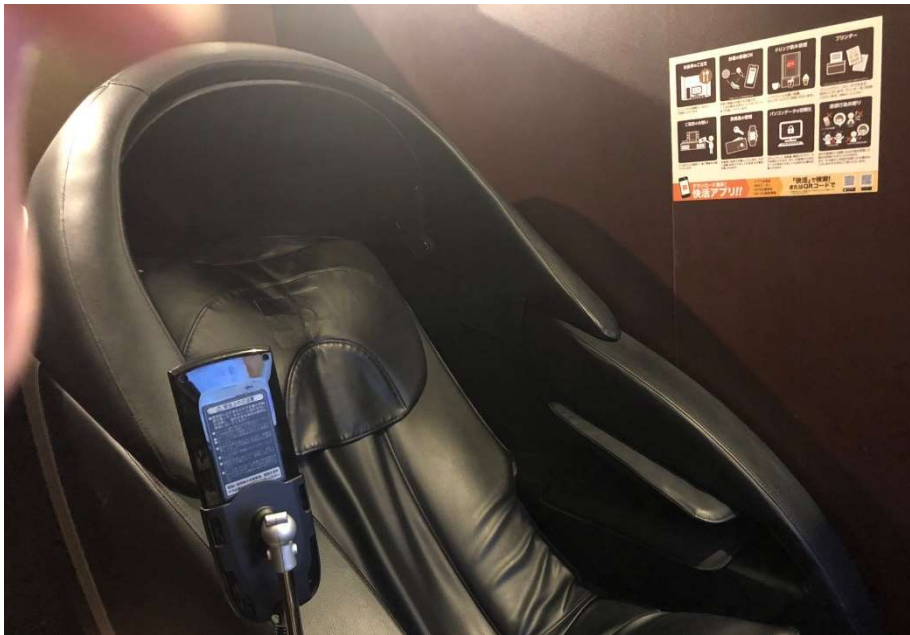
快活 CLUB のマッサージブース