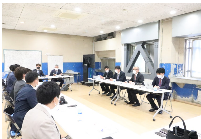
日本YEGメンバー（左）と吉本興業の皆様（右）

日本商工会議所青年部（以下日本YEG）は、2022年4月22日（金）吉本興業ホールディングス株式会社 新宿本部（以下吉本興業グループ／東京都新宿区）を事業連携の挨拶で訪問した。