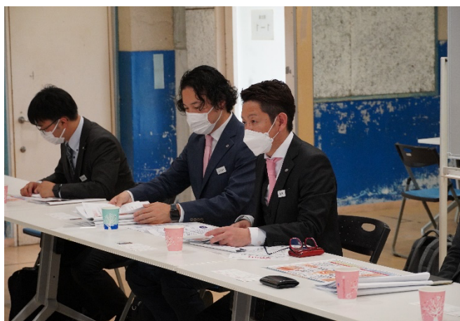
日本YEGの活動を説明する西村会長（右端）