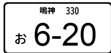
ナンバープレート末尾20の例