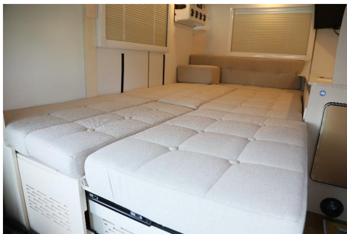
ベッド展開した Happy1+ の車内

今後、ランキング上位に入るキャンピングカーの条件は「標準装備の充実」になると予想しています。