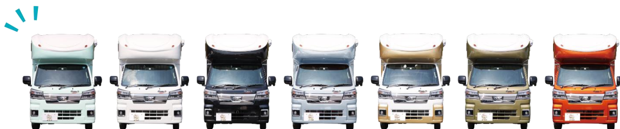
カラーバリエーションが豊富な Happy1 +

Happy1 + が人気の要因は、1 つは軽キャブコンをこの値段で販売したことです。標準で電動オーニングや、ナビ、ソーラーパネル、外部充電機能などを装備しています。その他におしゃれなカラーバリエーションを選ぶことができ、自分だけの一台にできる点が、男性だけではなく女性からの指示も集めています。また、最近では芸能人が同車種でおでかけする動画も人気で、動画をきっかけに名前を知った方も多いのではないのでしょうか。