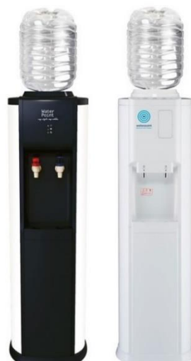
ミネラルピュアウォーター 「ウォーターポイントMineral Pure Water」