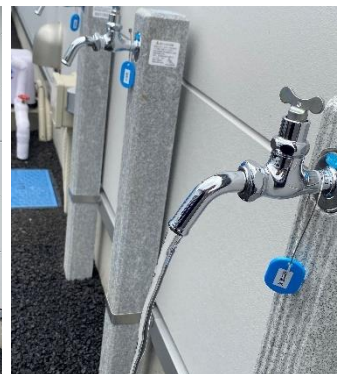
左：『ウォーターポイント八王子』外観 中央・右：災害時給水所、右から「生活用水」「飲料水」「水道水」「井戸水」を供給