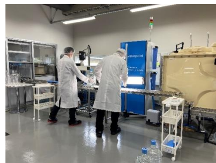
検品の様子（イメージ）