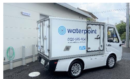
導入した EV 車

当社では、どこでも同じ最高品質の製品水を造るため、地下水の溶解成分を徹底的に除去する“W逆浸透膜”で精製した「超純粋水」に世界自然遺産知床らうす「深海ミネラル」をブレンドします。“W 逆浸透膜”とは、他社の宅配水は逆浸透膜（RO 膜）での「ろ過」1 回の純水を提供していますが、当社では、逆浸透膜のろ過を 2 回行い、さらに純水装置を通すことで、純水の質がさらに高い「超純粋水」を精製しています。限りなく不純物ゼロの水を造るためさらに高度な水処理を行います。また、配合するミネラルは人工ミネラルではなく、天然ミネラル（知床らう