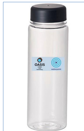
左：『CAFÉ OASIS 秋葉原店』外観、中央：店内設置の「深海の恵水（めぐみ）」、右：プレゼントのマイボトル（イメージ）

『CAFÉ OASIS 秋葉原店』には、当社の水の自動販売機「深海の恵水（めぐみ）」を設置しており、カフェの利用時にこだわりの水を提供しています。また、カフェ利用後は、お手持ちの“マイボトル”に無料で給水いただき、こだわりの水を持ち帰っていただくマイボトル給水サービスも実施しています。今回のキャンペーンは、本格的なサマーシーズンを前に、マイボトル給水サービスの普及とプラスチックごみ削減のきっかけ作りのため、期間中に店内商品をお買い求めのお客様、各日先着 100 名様にマイボトルをプレゼントいたします。