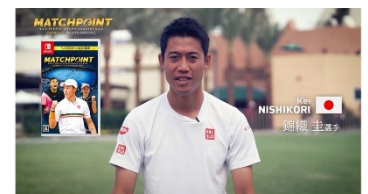
錦織圭選手からのメッセージ動画を公開中！

世界の第一線で活躍する 16 選手が実名で登場。日本が誇る錦織圭選手(以下選手敬称略)はもちろん、今シーズン目覚ましい成長を遂げているスペインの 19 歳 カルロス・アルカラスやアメリカのアマンダ・アニシモバなど、今のテニス界をリードする世界のトッププレーヤーとのマッチアップをお楽しみいただけるほか、選手たちをプレイアブルとして選択することも可能です。戦略を極めた CPU との歯ごたえある一戦に加えて、ローカルやオンライン対戦でも楽しめるモードです。