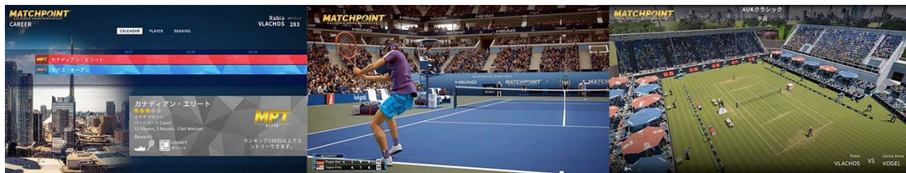
▲ツアーカレンダー