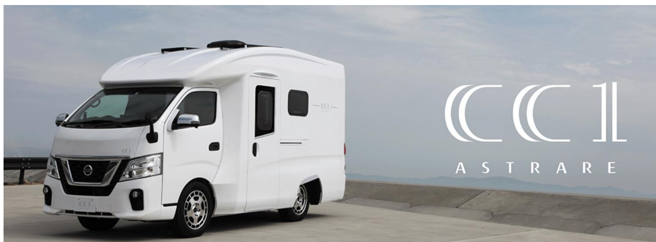
新型キャンピングカー『ASTRARE CC1（アストラーレ CC1）』