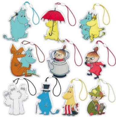
ムーミンフルカラーリフレクター

特典：「新型コロナワクチン接種証明書」（3 回目接種済みのもの）を提示いただいた方 先着 200 名に、人気キャラクター反射材をプレゼント。