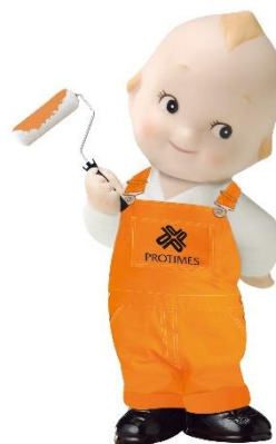
(イメージキャラクターシンボルマーク)

全国の優良な塗装専門店が集結し、手抜き工事を一切しないルールづくりや、お客さまが生涯にわたって塗装工事を任せたいと思っていただけるサービス基準を構築。全国のどのエリアでも同じ安心をお届けするための仕組みづくりに取り組んできました。