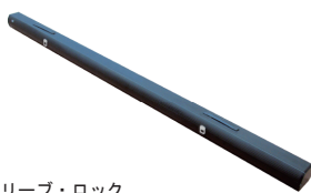
回転脚を閉じた 収納時外観 SVS-103FN-H-WV103