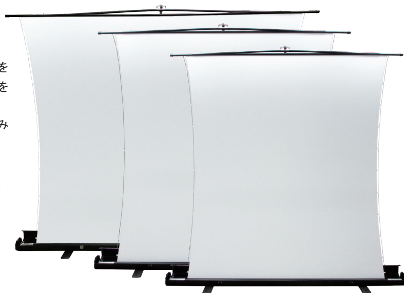
photo: 超短焦点プロジェクターでも歪みの無い映像（左）、SVS-63FN-H-WV102（前）、SVS-83FN-H-WV102（中）、SVS-103FN-H-WV103（後）