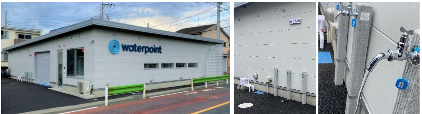
左：『ウォーターポイント八王子』外観 中央・右：災害時給水所、右から「生活用水」「飲料水」「水道水」「井戸水」を供給

今後も『ウォーターポイント八王子』は、八王子市やその近隣エリアの地域貢献を拡大していきたいと考えております。宅配水として、また商業施設やドラッグストアなどでの提供も含め、水の提供を通じて地域に根付いた活動を続けてまいります。