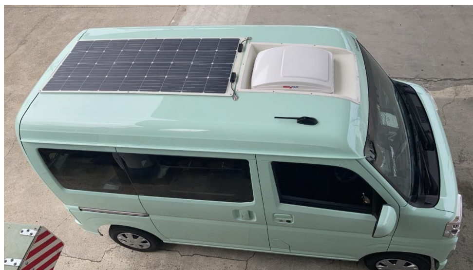
Chippy は運転席・助手席上部にベンチレーターを搭載

チッピーは普段使いしやすい軽自動車の特性はそのままに、1 分で就寝用ベッド展開も可能です。運転席・助手席上部に設置されたベンチレーターも特徴です。吸気口をリアハッチに設置し、リアハッチからルーフベントへの換気機構にもこだわりを感じます。その他、人気要素となる標準装備もキャンパー厚木らしく充実しています。