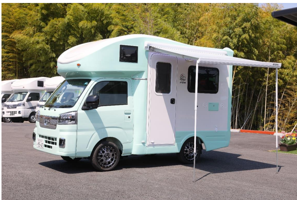
Happy 1 + に標準装備されている電動 LED ライト付サイドオーニング