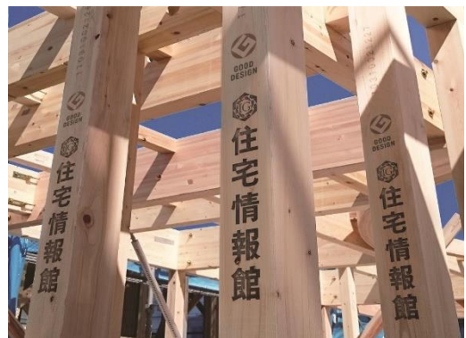
国産無垢檜柱(施工事例)

外壁は通気金物施工の 16mm 防火サイディング張りで、床下・外壁・屋根裏を通じた換気と通気で湿気や熱気を適切に建物外に排出して建物の劣化を防ぎ耐久性を高めています。