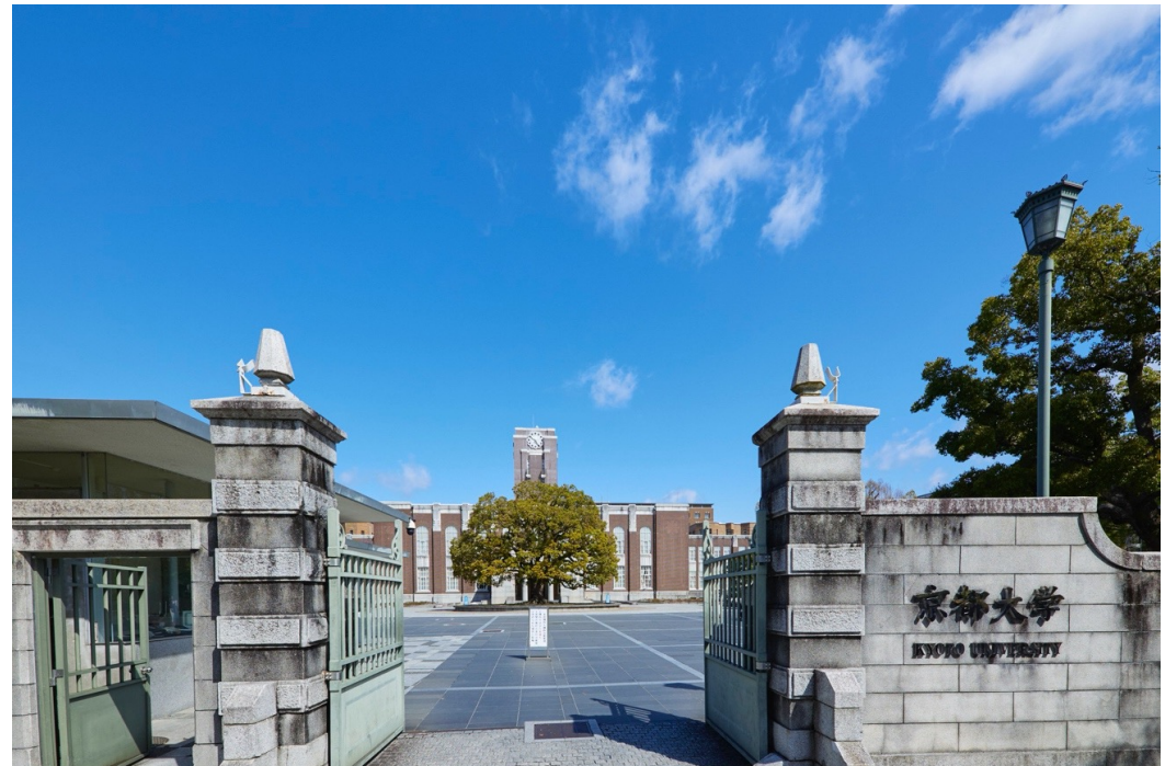
京都大学 吉田キャンパスにて