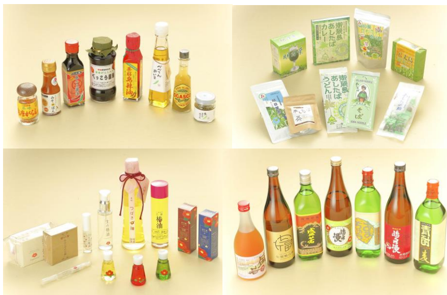
※販売商品イメージ

「東京愛らんどフェア」は、東京諸島における、豊かな自然環境とそこでの人々のくらしや文化・観光資源・特産品など、これら地域の魅力を広く紹介するイベントです。