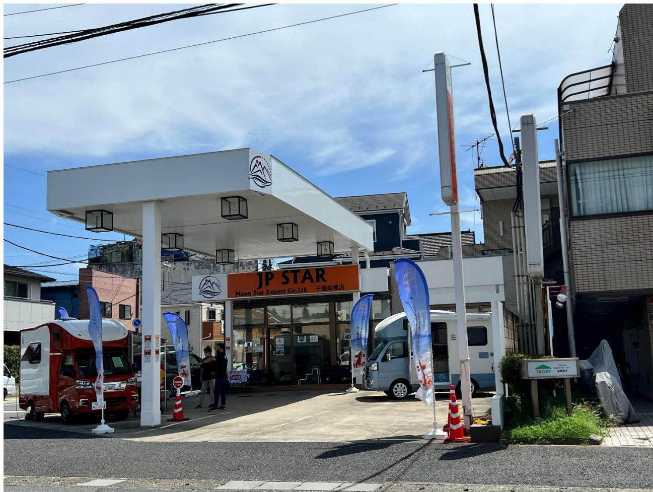
JP STAR 千葉船橋店 外観

軽キャブコンの為、客層も夫婦やソロ利用の方が中心になると思いましたが、小さなお子さんがいらっしゃる購入者も多いとの事。またカラーも豊富に選ぶことができるところが購入者に喜ばれているそうです。販売代理店が増えており、販売も好調とのこと。