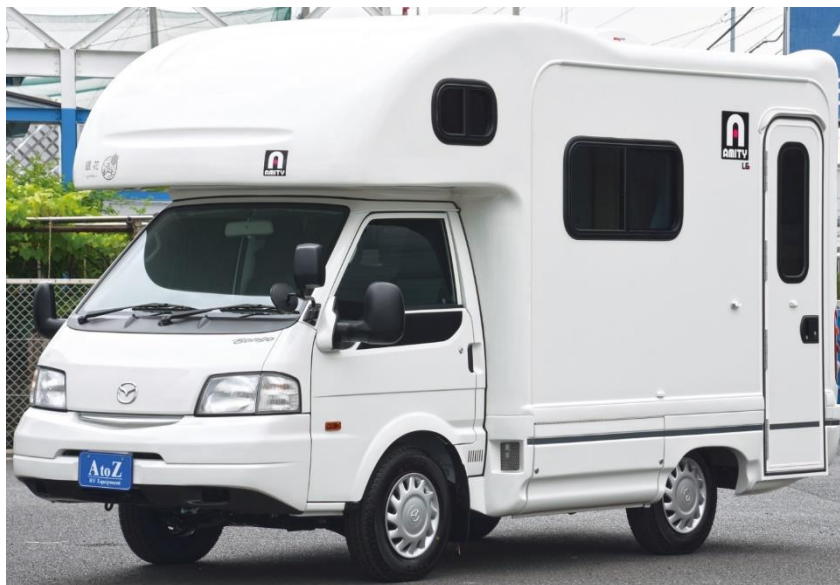
生産終了後も注目される アミティ LE

最新の総合ランキングはこちら https://japan-crc.com/ccn/viewrank/