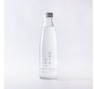
スパークリングウォーター

ほうじ茶の香ばしい香りとサクサクの食感がクセになるクッキー。佐賀県嬉野産のほうじ茶を使用したフェア期間限定商品です。