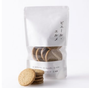
ほうじ茶クッキー

佐賀県唐津市の富田農園の希少な黒イチジクを使用した期間限定マフィン。しっとり焼き上げた生地と濃厚な甘さのイチジクの組み合わせは秋のおやつにもぴったりです。