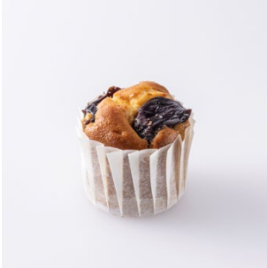
イチジクのマフィン