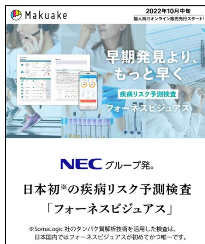
「Makuake」予告サイトのイメージ

そこで、当社の理念や「フォーネスビジュアス」のサービスに共感いただいた方に広くご利用いただく場として、「生まれるべきものが生まれ、広がるべきものが広がり、残るべきものが残る世界の実現」をビジョンに掲げている応援購入サービス「Makuake」を通して先行販売を開始します。「Makuake」より応援購入いただいた方には、数量限定で本サービスを定価から最大 23%OFF で提供します。詳細は、予告サイトでご確認ください。（予告サイト： https://www.hotitem.online/fonesvisuas ）