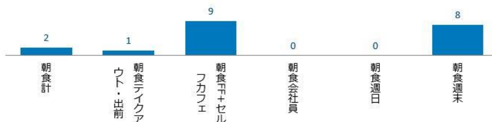
＜図表2＞ 外食・中食における朝食の食機会数 2022年7月 2019年同月比%

他、テイクアウト・出前、会社員の利用、週日の利用も 2019 年同月と同程度の水準まで海津くしています。