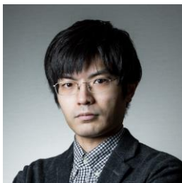
ITmedia ビジネスオンライン

「Digital Business Days」では、「ITmedia ビジネスオンライン」、「ITmedia NEWS」両編集部のプロデューサーチームが、ビジネスとテクノロジーの未来に向けたコンテンツ・企画を打ち出します。