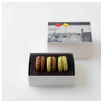
マカロン3個詰合わせ 1,566円（税込）