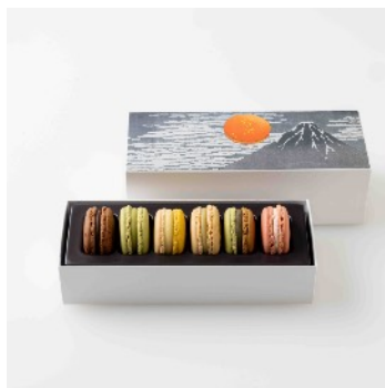
マカロン6個詰合わせ 2,862円（税込）