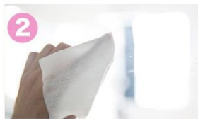
2 窓をクリーニング。