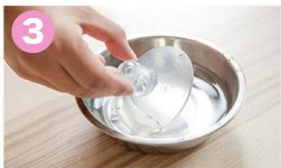
3 2~3分お湯に漬けると吸着効果がアップします。