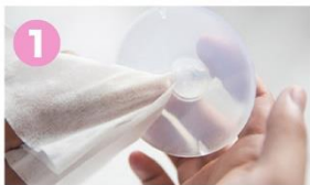
1 吸盤をクリーニング。