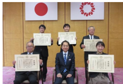
↑ 受賞企業での集合写真(後列中央が当社)