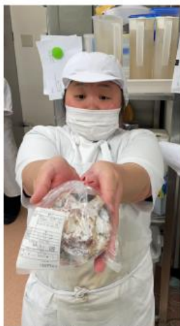
↑ 出来立てのパンを撮らせて下さいました