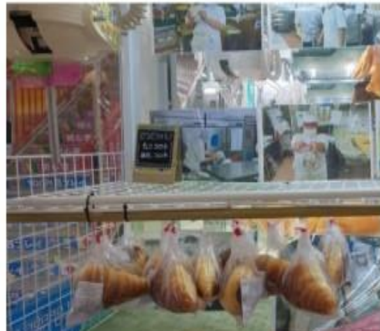
↑ 毎日焼きたて！パンキャッチャーの台の画像

2021年4月1日よりこの取り組みが始まる前は、 製造や物流の問題、賞味期限の問題など 、お互い 様々な課題 がありましたが、今では、福祉施設支援クレーンゲーム【毎日焼きたて！パンキャッチャー】が、障がいを持った方の自立や就労支援、働き口や生きがいを守るためにのみならず、パンドノアさんのパンを楽しみにご来店頂き、 地域の方に喜んで頂いている証 だと感じております。