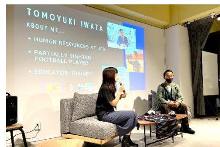
受講生と担当コンサルタントの対談