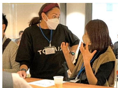
ネイティブコーチと 英語で交流

「Alumni & Students Party」は、新型コロナウイルス感染拡大の影響により、3 年ぶりとなるオフライン形式で開催しました。受講生・修了生の皆さまに事前アンケートを実施したところ、直接顔を合わせて他の受講生や修了生、コンサルタント・コーチ陣と話してみたい、というご希望を多くいただき、今回の開催の運びとなりました。開催のご案内後には、数日で当初の想定人数を超えるお申し込みをいただき、当日も多くの方が参加されました。