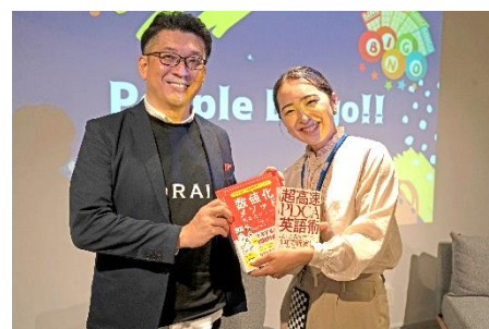
ゲームの賞品は トライオン代表 三木の書籍