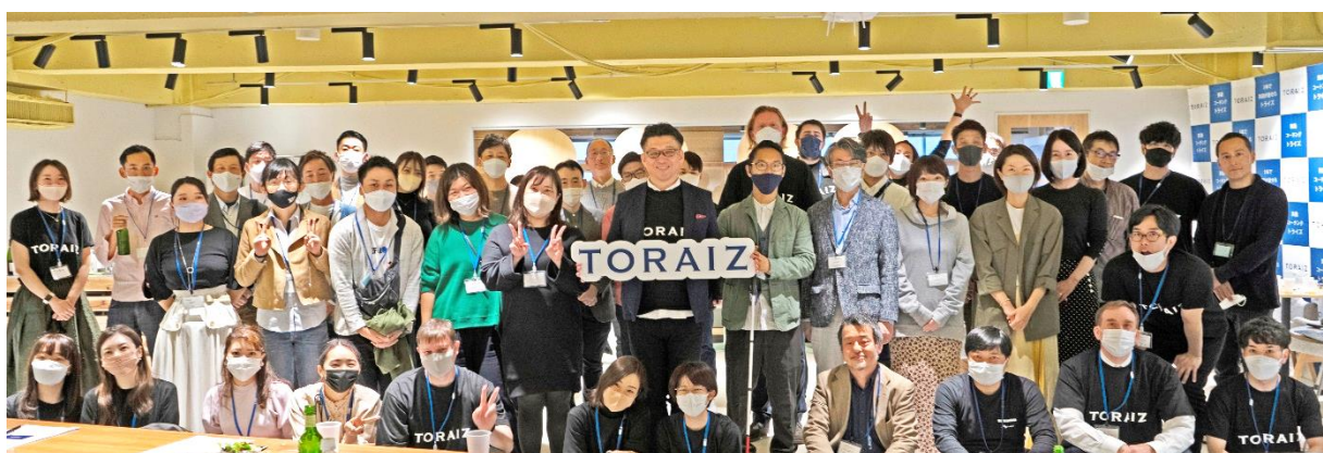
TORAIZ「Alumni & Students Party」参加者とスタッフ一同