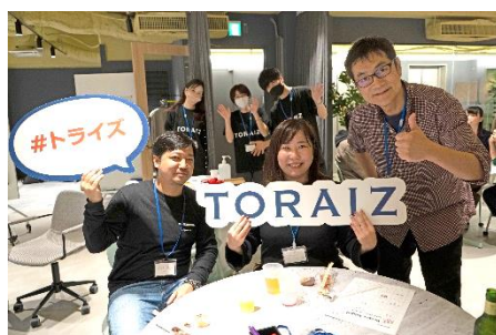
初対面の参加者同士も 和やかに歓談