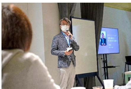
「英語プレゼン特化コース」 修了生のプレゼン