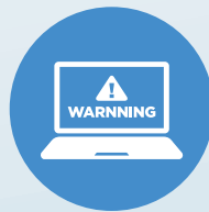
アクセスさせたくない 有害サイトの閲覧