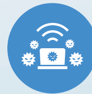
ウイルス感染した デバイスから外部への通信