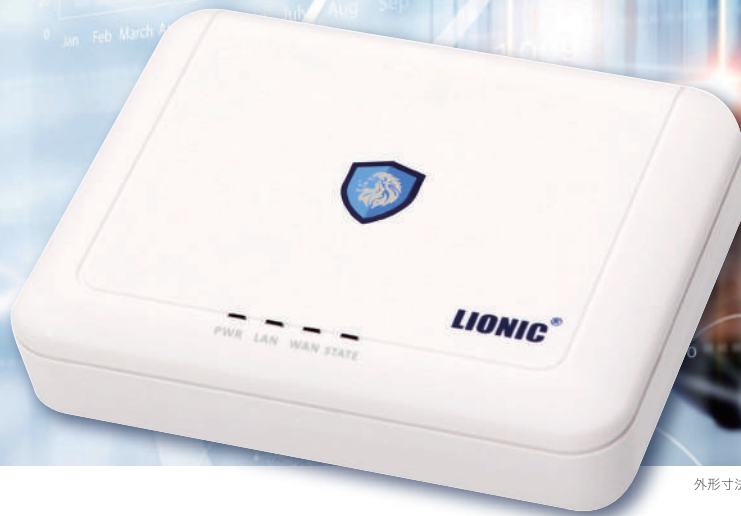
外形寸法(mm):約116(W)×25(H)×91(D) 質量:約135g

セキュリティ対策の人員不足も、 セキュリティ対策に大きなコストをかけられなくても、 これ1台で全て解決。