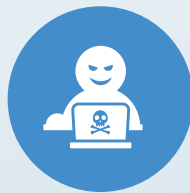
脆弱性を突く 不正侵入・サイバー攻撃