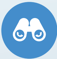
ポートスキャンの 悪用