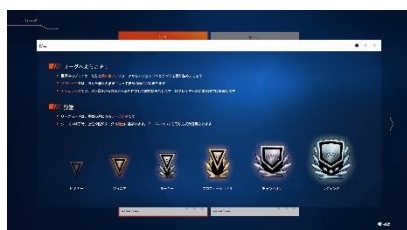
▲成績に応じて、プレイヤーは6段階のリーグに振り分けられる

各シーズンは、1週間の予選フェーズと、10週にわたり繰り広げられる本戦から構成されています。本戦ではデイリーイベントとウィークリーイベントが開催され、プレイヤーはそれらに参加することでグループランキングでより上の順位を目指すこととなります。各週の終わりにはランキングの再算定が行われ、戦績に基づいて新たなランキングが決まり、それに応じた経験値が与えられます。この経験値は、ドライバーカードのカスタマイズ要素や、カラーリングエディターで使えるステッカーなどのアンロックに使うことができます。