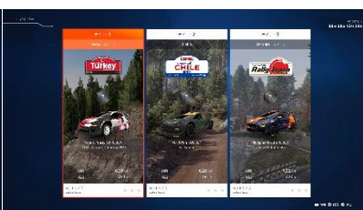
▲各ミッションには、コースやマシンのほか気象条件なども設定されている