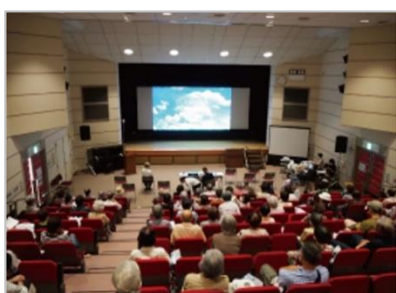
終活映画の上映会や大抽選会で盛り上がりを見せた今年の「いのちのリレーまつり」

2013（平成 25）年からは精華町「いのちのリレーまつり」に協賛として参画。今年で 7 回目を迎えた「今を大切に生きる」「命の大切さ」を考えるこの終活イベントには、約 160 名の地域の方々に参加されました。その他「いすヨガ体験教室」※や「想い出供養祭」などの地域イベントを数々開催する一方、接触を控える時勢も踏まえて Instagram や LINE などを駆使した情報発信も積極化。オフライン・オンラインの両面で、地域に元気と潤いをお届けしています。