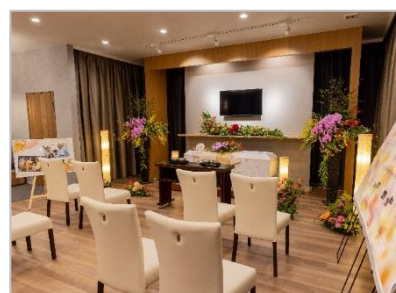
奈良 1 号店「ファミーユ奈良押熊ホール」。オーブニングイベントには大勢の方が集いました

※「いすヨガ体験教室」は好評につき 11 月 27 日（日）にイマージュホール京田辺でアンコール開催します。