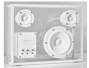
TRANSPARENT Speaker ホホワイト