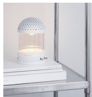
Light Speaker ホワイト

2021 年に初登場した、焚き火の揺らぎのようなライトが光るポータブル Bluetooth®スピーカー「Light Speaker」にも新色のホワイトが加わります。音楽に共鳴する火の揺らぎのようなライトにこだわり開発され、室内はもちろんキャンプや海辺など屋外にも持ち出せるポータブル Bluetooth®スピーカーです。見た目のコンパクトさからは想像できないほどの迫力ある低音とクリアなサウンドが特長です。