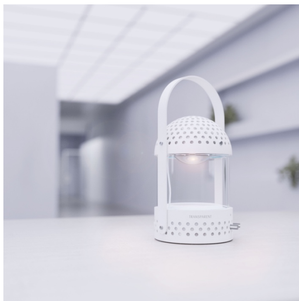
（向かって左） TRANSPARENT Speaker ホワイト