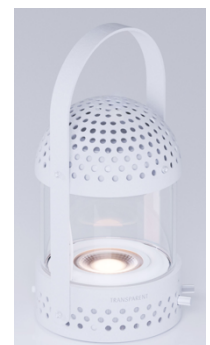
Light Speaker ホホワイト