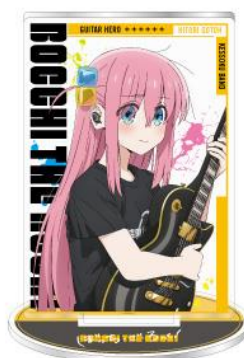
アクリルスタンド