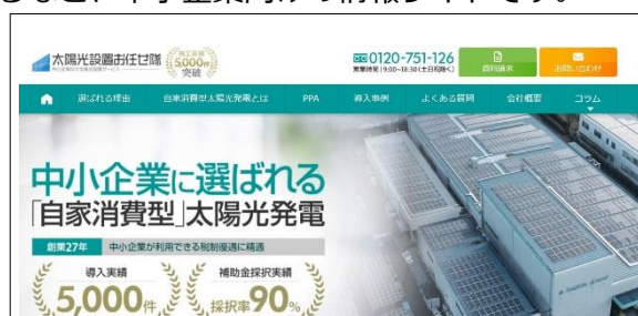
<太陽光お任せ隊> サイトトップページ

創業 28 年、中小企業に選ばれる「自家消費型太陽光発電」の導入実績は 5,000 件を超え、業界でもトップクラスの実績数を誇っています。特に中小企業が利用できる税制優遇に精通し、補助金採択率は 90%（※2020 年度から 2021 年度の導入実績から算出）に達しています。