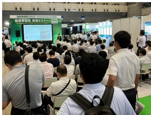
開場すぐの時間枠でも満席に

開場からすぐの時間枠にもかかわらず満席となり、その後の問い合わせも 15 件いただき、電気代高騰や SDGs 推進を検討する法人需要の拡大を実感しました。