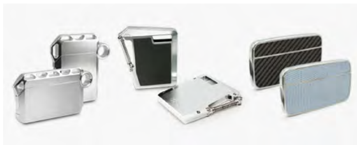
FACTRON 既存の名刺ケース

弊社既存のメタル削り出し名刺ケースのお客様からの「FACTRON の名刺入れは金属製なので、スキミング防止にクレジットカードを入れている」というお話から、クレジットカードケースの開発をスタート。試行錯誤の末、カード類だけではなく紙幣やコインも収納でき、また紙幣は三つ折りの手間なく二つ折りで差し込める、コンパクトなカードケースという結論に至りました。