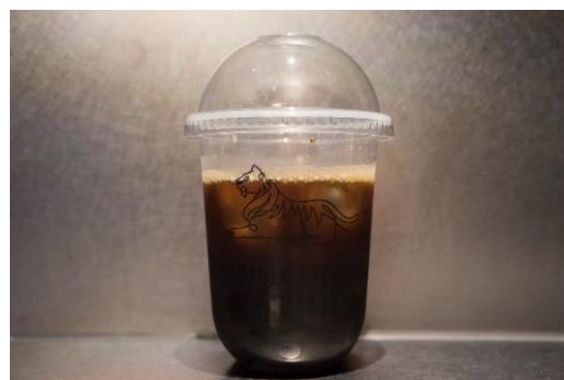
無農薬スペシャルティーコーヒー