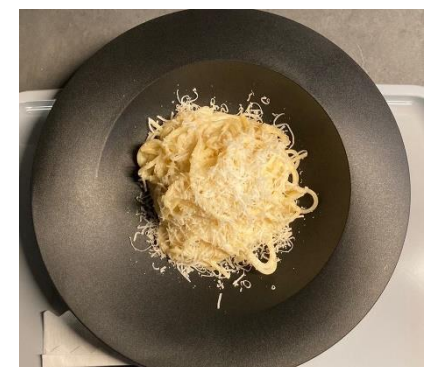
5 種のチーズソーススパゲッティ