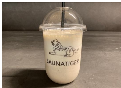
濃厚バナナジュース