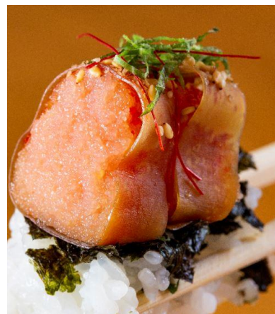
自家製「昆布巻き明太子」

日本初の明太子料理専門店「元祖博多めんたい重」(所在地：福岡市中央区)では、お客様へ幸福が訪れるようお願いを込め、2023年元旦より「めでたいこ・よろこんぶステッカー」をご来店のお客様へお配りいたします。当店発祥の「元祖博多めんたい重」は、子孫繁栄を願う食材の明太子(めでたいこ)や昆布(よろこんぶ)など、祝いの席に欠かせない縁起物が多く含まれており、新年にふさわしい料理です。また、贈答用の自家製昆布巻き明太子やお弁当は、帰省の手土産や大切な方への贈り物としても喜ばれております。めんたい重を通して、“めでたいこ”とがありますよう、心をこめてお作りいたします。