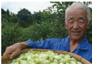
自然豊かな里山で、大切に育てています。