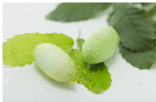
日本原産の緑色のまゆ“天蚕”

群馬県中之条町。自然があふれる里山に、広がる美しい緑のまゆ。日本伝統を継承する天蚕農家の方々によって、一粒一粒愛情を込めて大切に育てられています。天蚕は一年に一度だけ、白いまゆの1%以下しかとれない貴重なワイルドシルク。