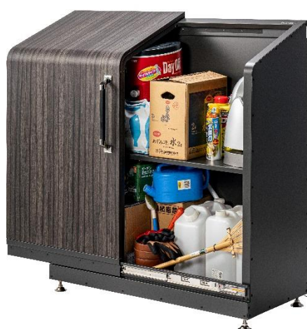
左：『スライドダスポン ハイスリム』

ステンレス製品の製作・加工・販売をおこなう株式会社ナカノ（本社：富山県黒部市、代表取締役社長：中野 隆志）は、独自開発した“横スライド式”ゴミステーション「ダスポン」シリーズから、従来品よりスリムな『スライドダスポン ハイスリム』を、2023 年 2 月 3 日（金）より発売開始しました。