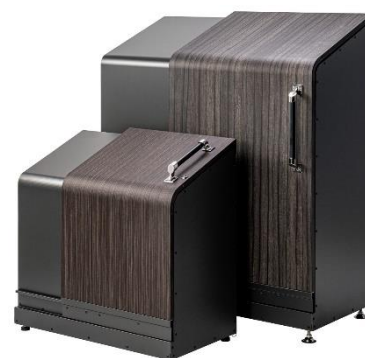
奥：『スライドダスポン ハイスリム』 従来の家庭用よりスリムにし省スペース化

これまで通り、足元まで大きく開閉する“横スライド式”の開閉口は、ゴミ袋を入れる際に上まで持ち上げる必要がないので、女性や高齢者でも出し入れが簡単です。また、投入口が閉まる数センチ前でスライドが減速し、手を挟む心配ないソフトクローズ機能も標準装備し、女性や高齢者のわずかな力でも安全に開閉できます。