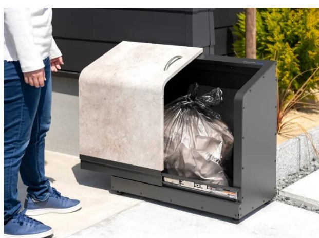
右：ダスポン利用イメージ