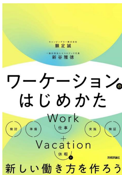
ワーケーションのはじめかた（技術評論社）

キャンピングカー株式会社（本社：東京都渋谷区、代表取締役社長：頼定 誠）は、2 月 6 日（月）一般社団法人エコロジック（本社：静岡県富士宮市、代表：新谷雅徳）との共著、早稲田大学ビジネススクール 根来龍之教授監修となるワーケーション導入のための入門書籍「ワーケーションのはじめかた」（出版社：技術評論社）の刊行をお知らせいたします。（URL： https://gihyo.jp/book/2023/978-4-297-13316-0 ）