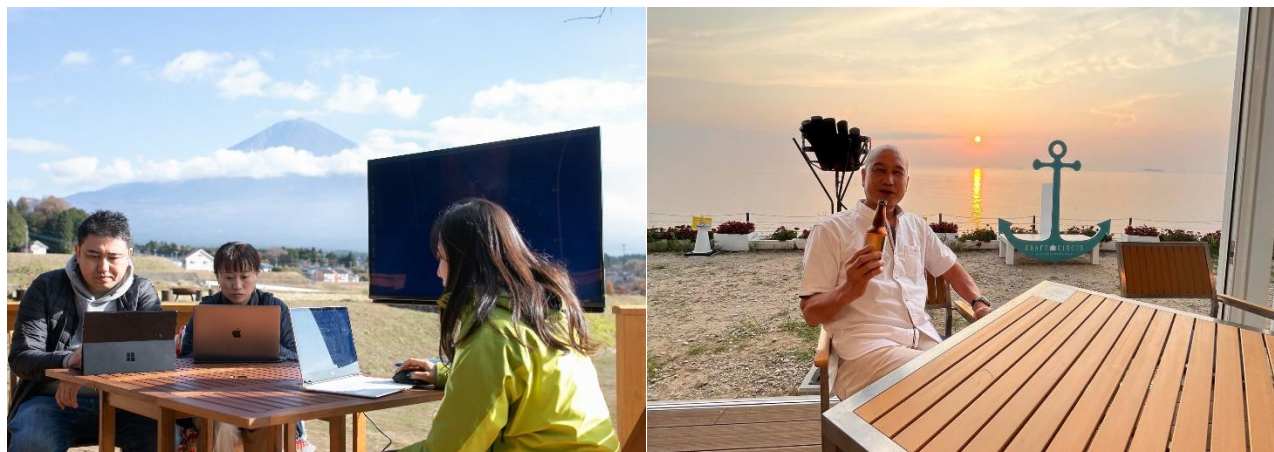
ワーケーション風景事例（本書抜粋）