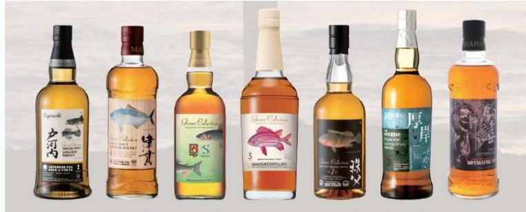
テイスティングセミナーボトル