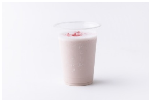
桜のスムージー 756円／770円 (テイクアウト／イートイン)

自家製の桜シロップを炭酸水で割り、大胆に桜の葉をあしらった限定ドリンク。桜の甘い香りが春を思わせる爽やかな一品に仕上がりました。