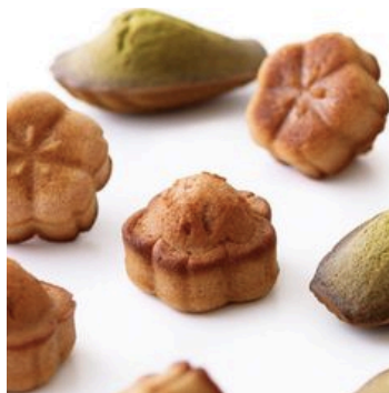
桜のフィナンシェ 1個 216円／220円 （テイクアウト／イートイン）

さくらんぼのジューシーな甘酸っぱさと、ほのかな桜の香りがマッチしたマフィン。春の訪れを思わせる、期間限定フレーバーです。