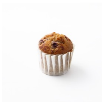
桜のマフィン 432円／440円 （テイクアウト／イートイン）

さくらんぼのジューシーな甘酸っぱさと、ほのかな桜の香りがマッチしたマフィン。春の訪れを思わせる、期間限定フレーバーです。