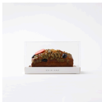
桜と黒豆のパウンドケーキ 1,728円 （テイクアウト）

※渋谷 東急フードショー、ルミネ大宮限定 春爛漫という言葉がぴったりな桜フレーバーのフィナンシェ。淡いピンク色の桜のかたちも可愛らしく、ご自宅用はもちろん、春の贈り物や手土産にも。