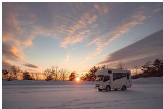
夕日とキャンピングカー

本プラン専用のゲレンデ直結スペースをご用意。リフトのすぐそばにステイしていただくので、車内で準備らそのままゲレンデに滑り出すことが可能です。休憩時も周りを気にせず、広々とした車内でくつろぐことができます。1日中ゲレンデを眺めながら過ごせるのも車中泊ならではの醍醐味です。