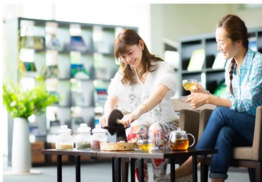
ラウンジでオリジナルのお茶づくり