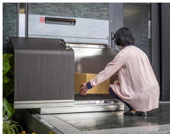
「ダスポン」利用イメージ