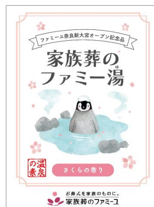
さくらの香りの“家族葬のファミー湯（ユ）”

【開催日時】2023年3月4日（土）～3月9日（木） 各日10:00～16:00（予約不要）