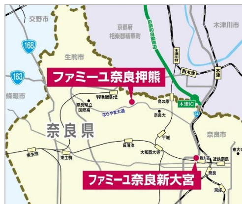
奈良市内2店舗の展開で、高まる家族葬のニーズに対応

これまで、けいはんな地域を中心に8つの葬祭ホールを展開してきた「花駒」が、ファミーユブランドの家族葬専用ホールを新大宮エリアに出店します。奈良市内は、2021年6月に開店した「家族葬のファミーユ 奈良押熊ホール」に続き2店舗目。近鉄奈良線「新大宮駅」から徒歩圏内で、国道24号線に面した利便性の高い立地です。心を落ち着かせるモノトーンで統一したシンプルな外観の「1日1組・貸切」の家族葬専用ホールで、大切な方との最後の時間を、ご家族や親しい方とゆっくりとお過ごしいただけます。