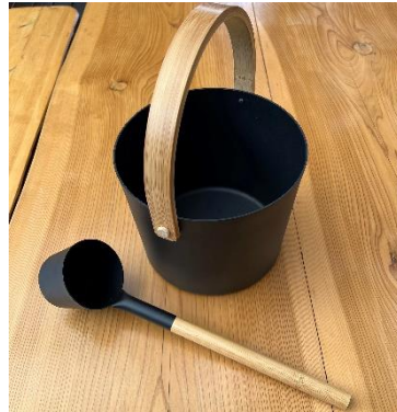
セルフフローリュバケツ