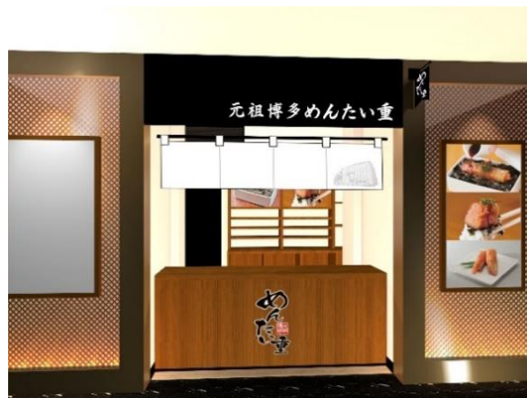
※店舗イメージ画像

今回も、専門店ならではのこだわりの商品を取り揃えております。一番人気のお弁当は、最も美味しく召し上がっていただくために、店内厨房でひとつずつ丁寧に詰めたお弁当を、出来立ての状態でご提供いたします。日頃より名物みやげとしても人気の「自家製昆布巻き明太子（元祖博多めんたい重セット）」や、店舗限定商品として人気の濃厚つけ麺「めんたい煮こみつけ麺（お持ち帰り用）」も同時販売いたします。地元福岡の皆様の自慢の手みやげや、福岡旅行の思い出の品としてもおすすめです。