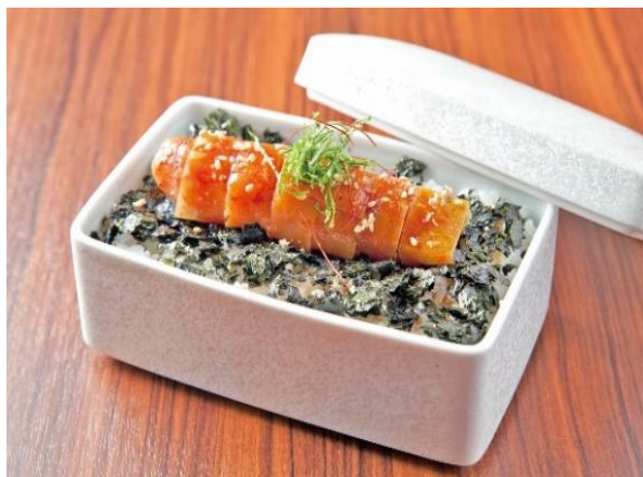
※商品イメージ画像

2022年12月に期間限定で、福岡空港の国内線2階にて初めて催事出店いたしました。ありがたいことにたくさんのお客様にご来店いただき、大盛況のうちに終了することができました。その後、嬉しいことに再販のお声を多数頂戴し、この度「陸の玄関口」としてにぎわう博多駅に期間限定で出店する運びとなりました。