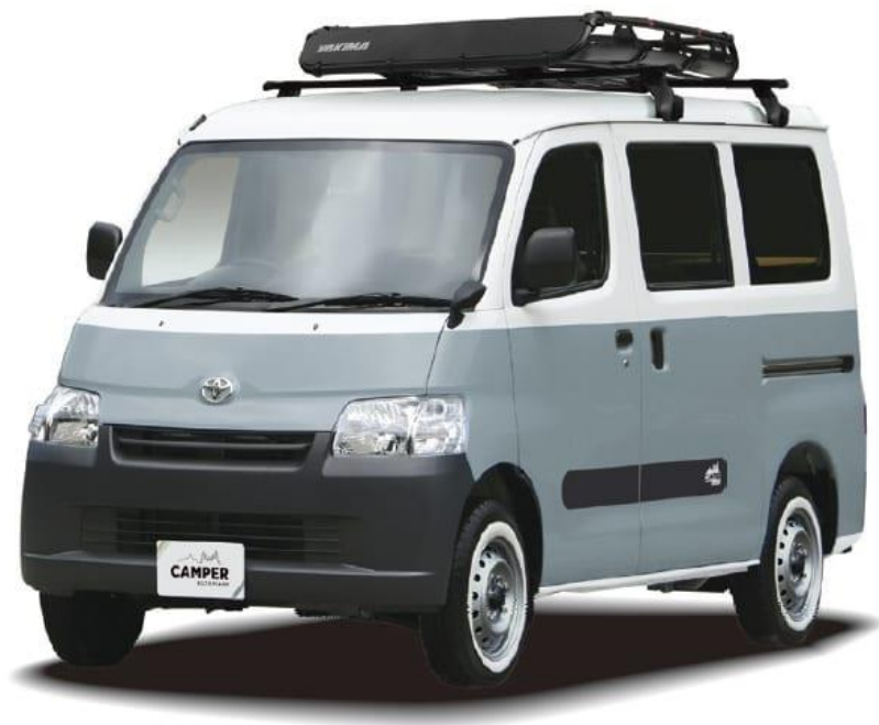
3 位キャンパーアルトピアーノ（トヨタモビリティ神奈川）

2023 年に入っても、軽キャンピングカーや普段使いしやすい車が人気を博しています。特に、車中泊仕様にした乗用車がランキング上位に入る傾向があり、今回のランキングでは、3 位キャンパーアルトピアーノ（トヨタモビリティ神奈川）、5 位 N-VAN コンポ（ホワイトハウス）、6 位 ヴォクシー DAYS POP（ホワイトハウス）、8 位 N ボックス + キャンパー Neo（ホワイトハウス）が外見からはキャンピングカーとは見えない作りの車となっています。