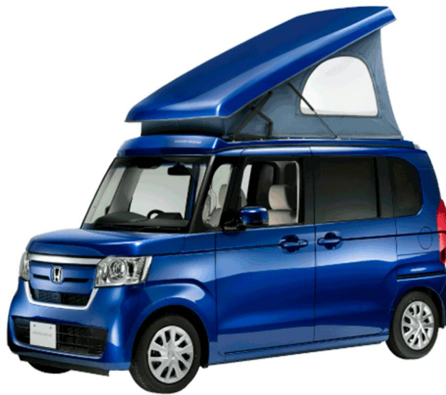
8 位 N ボックス + キャンパー Neo (ホワイトハウス)

最新の総合ランキングはこちら https://japan-crc.com/ccn/viewrank/