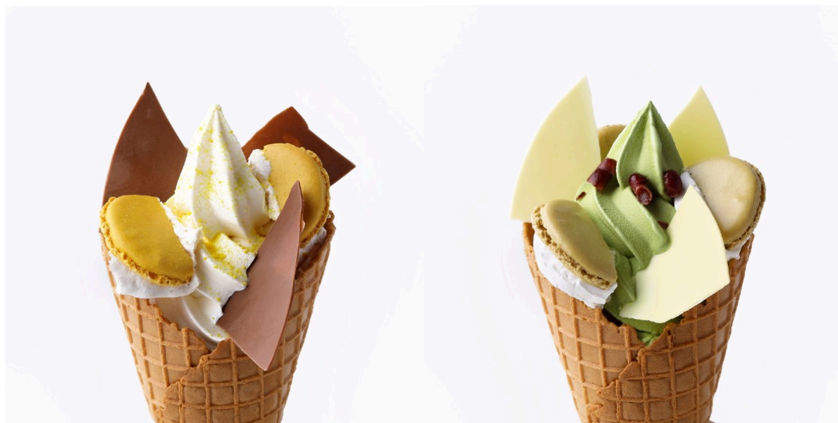
左) バニラのソフトクリーム、右) 抹茶のソフトクリーム