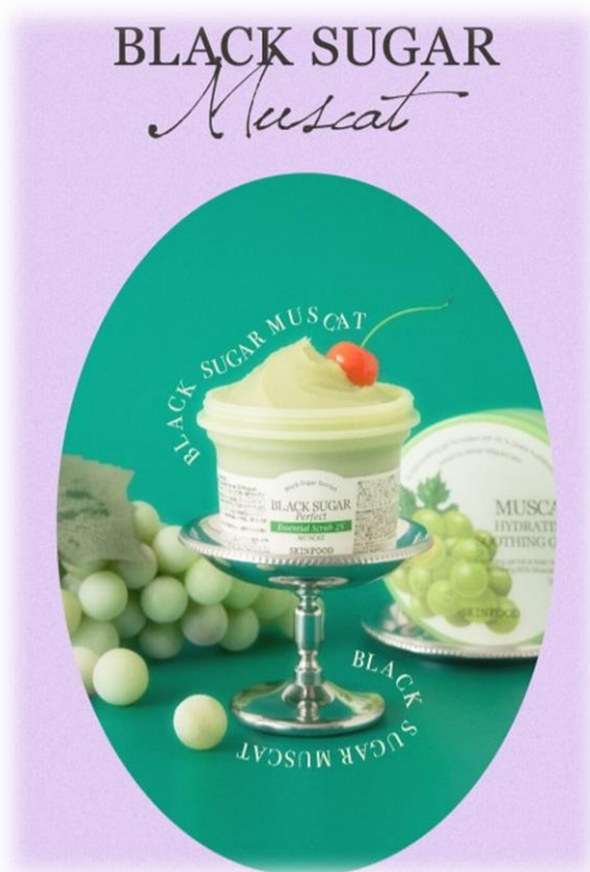
（写真中央：ブラックシュガー パーフェクト エッセンシャルスクラブ 2X マスカット、右：マスカット ハイドレーティング スージングジェル）

株式会社フードコスメ（東京都中央区銀座/代表取締役社長：飯田悠起）は、ワインやシャンパンの原料にもなるマスカットの弾けるように爽やかな香りを感じながら、顔もボディもツヤぶる肌に導くスキンケアライン「スキンフード マスカットエディション」2商品を数量限定で発売します。初夏の日差しでごわつく肌をなめらかに整えるので、自信を持って薄着の季節を迎えたい方におすすめの限定商品です。